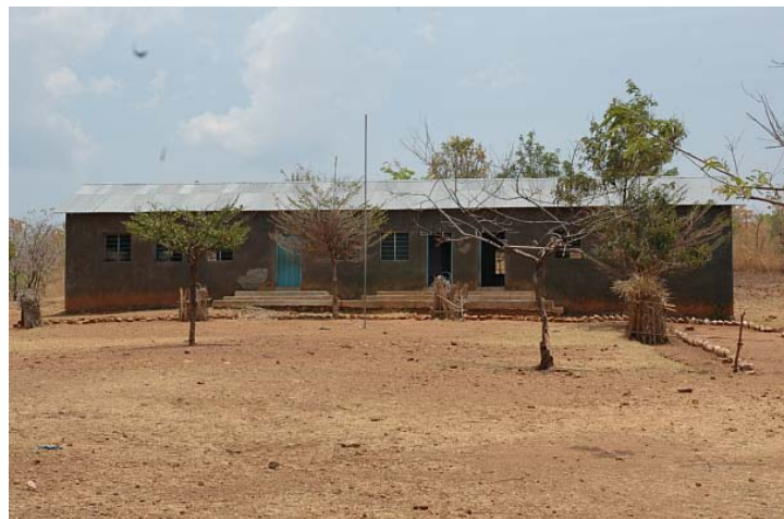
カトゥンビ小学校

まず、近隣のカトゥンビ小学校にノートと鉛筆といったごく基本的な教材の寄贈をおこなった。日本円にすればわずかな額の援助であるが、校長先生から直接礼状をもらうなど、やはり基本的教材への需要は大きいようである。多くの援助では、特定の年にだけ文具等を寄贈して終わり、ということになるが、それではそれ以外の学年の子供たちはまた教材がない状況に戻ってしまう。今後も少額でも継続的にこうした援助を継続したい。