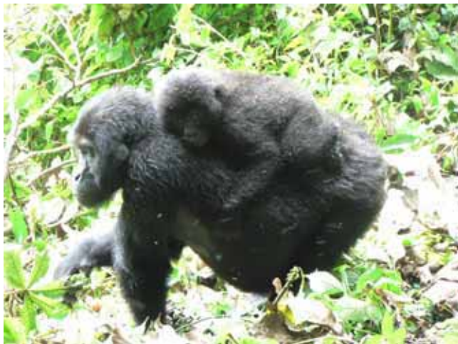
カフジでは今、ゴリラのベビーブームを迎えている