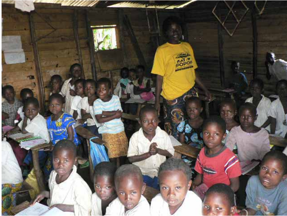
環境学級で元気いっぱい学ぶ子供たち